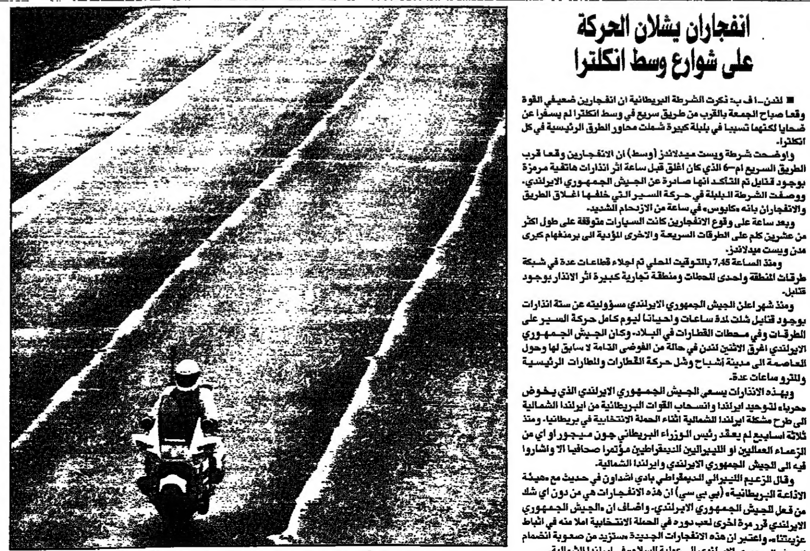
شريطي بريطاني يهزم دراجة النارية على شارع M16 السريع الذي خلا من السيارات عقب وقوع تحريكين على سبيل مفرقة منه.

وقال امير لجنه الشؤون الخارجية في مجلس النواب الامريكي في جلسة خاصة تبحث مسألة تدخل حكومة زائير في زائير في الاونة الاخيرة.